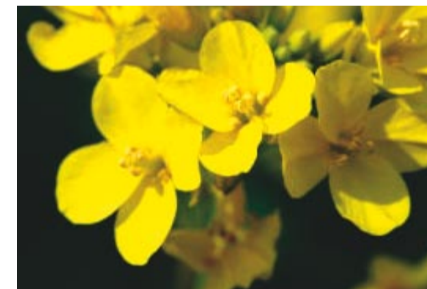
Crucifères en phase de floraison

L'innovation pousse sans cesse au cœur des terres d'Eure-et-Loir. Recherchant de nouveaux débouchés agricoles dans le domaine des biomolécules et du développement de filières spécifiques, la Société Coopérative Agricole d'Eure-et-Loir (SCAEL) basée à Chartres, développe désormais une plante riche en acide oléique.